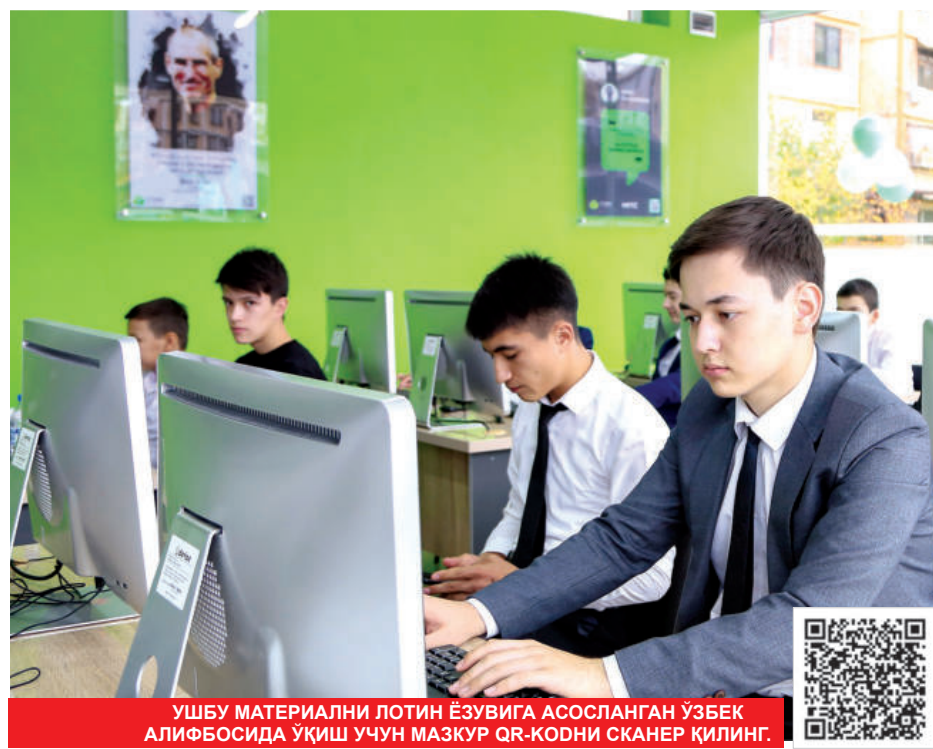
УШБУ МАТЕРИАЛНИ ЛОТИН ЁЗУВИГА АСОСЛАНГАН ЎЗБЕК АЛИФБОСИДА УҚИШ УЧУН МАЗКУР QR-КОДНИ СКАНЕР ҚИЛИНГ.

Агар икки киши сўзлашаётган ҳар қандай макон мафкура полигоии бўлса, миллий мафкура ва маънавият ҳолатини аниқлаштиришнинг жуда кўп тармоқларга эга комплекс тизими ишлаши зарур. Миллий мафкура ва маънавият масаласини, ҳаётдан, боринки, сўёсат ва иқтисодийётдан айри, фақат ахлоқ-одоб, маърифат, маданият, адабиёт, санъатдангина иборат, деб тушунадиганлар жиддий хато қилади.